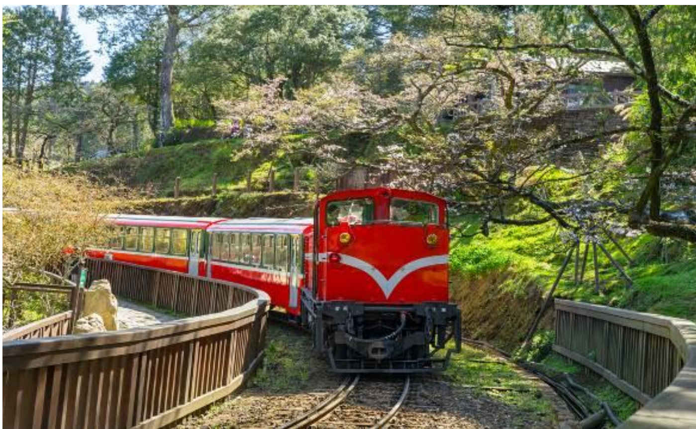
ไม่พลาดไฮไลท์ นั่งรถไฟโบราณอาลีซาน ชมป่าสนพันปี

แวะชิมชาอุ่นๆ ที่ ร้านใบชา ชาที่ขึ้นชื่อที่สุดของไต้หวัน มีรสชาติหอม มีสรรพคุณช่วยละลายไขมันปลุกบนเขาอาลีซานในระดับความสูงเป็นพันเมตรจากระดับน้ำทะเล และเป็นของฝากที่คนไทยนิยมซื้อกลับบ้านเป็นของฝาก